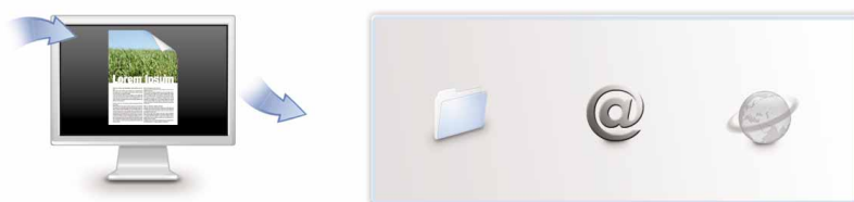
Escaneo a correo electrónico, carpeta y URL con un solo botón