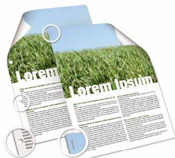
Grapa y perfora los documentos impresos

Se ha desarrollado un exclusivo finisher de 500 hojas para las MP C2050/MP C2550 que grapa y perfora los documentos producidos. Agregue a sus dispositivos una excelente calidad de impresión y gran manipulación de soportes, y tendrá en su propia oficina al socio perfecto de producción. Reduzca la contratación externa de producción de documentos, obtenga usted mismo documentos con un aspecto profesional.