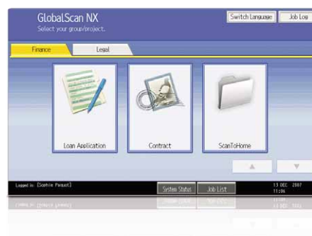
Interface gráfica de usuario sencilla y amena

Nuestro intuitivo sistema GlobalScan NX optimiza el flujo de trabajo del cliente al flexibilizar la distribución y el escaneo. Se pueden configurar iconos en los que preestablecer formatos de documentos y flujos de trabajo personalizados a través de una interface de usuario fácil de usar. Ya puede escanear en un solo paso desde el panel de mandos de las MP C2050/MP C2550.