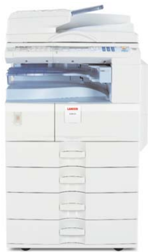
Modelo de fax/impresora/escáner LD125 estándar*

* El ARDF, el banco de papel y el gabinete son opcionales.