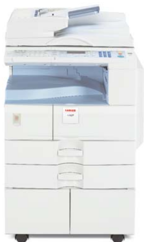
Modelo de copiadora LD125*